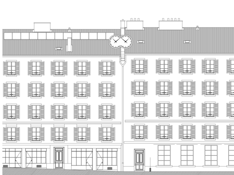
Plan d'installation en façade sur la toiture (élévation)

Des travaux d'envergure ont été menés par la Ville de Genève afin de les remettre entièrement à neuf. Ces immeubles font partie d'un ensemble de logements sociaux organisé autour du square Paul-Bouquet.